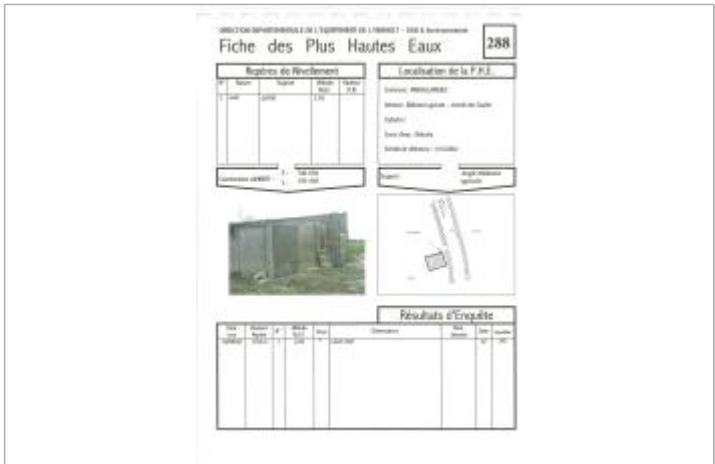
Fiche descriptive d'origine