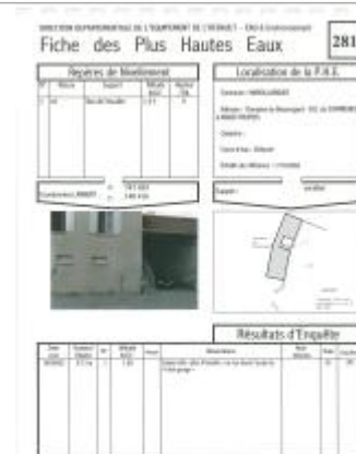
Fiche descriptive d'origine