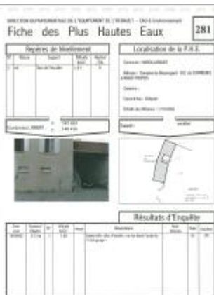
Fiche descriptive d'origine