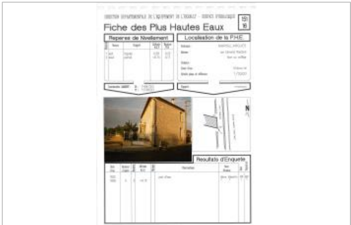
Fiche descriptive d'origine

GÉNÉRAL Code : 26_DDTM34_R_42_1 Date de mise à jour : 23/01/2026 Auteur : SPC MO