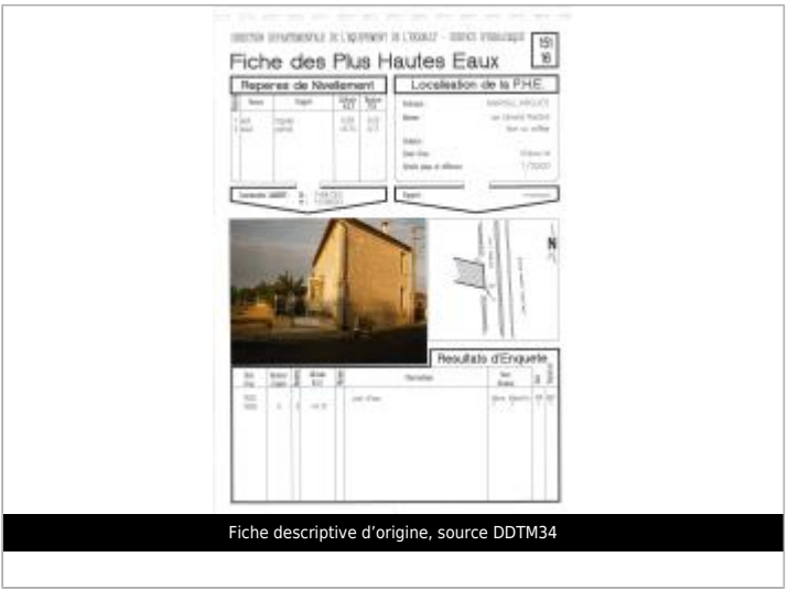
Fiche descriptive d'origine, source DDTM34

MARQUE Maximum de l'inondation : Non renseigné Visibilité : Non renseigné État du repère : Disparu Pérennité : Aucune Repère calculé : Non renseigné PHEC : Non renseigné