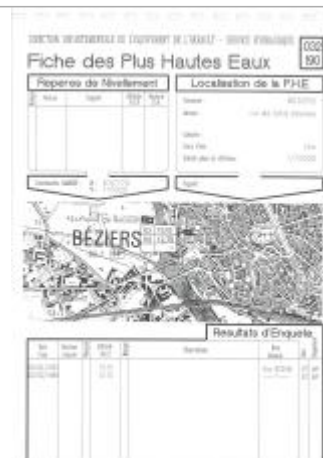
Fiche descriptive d'origine