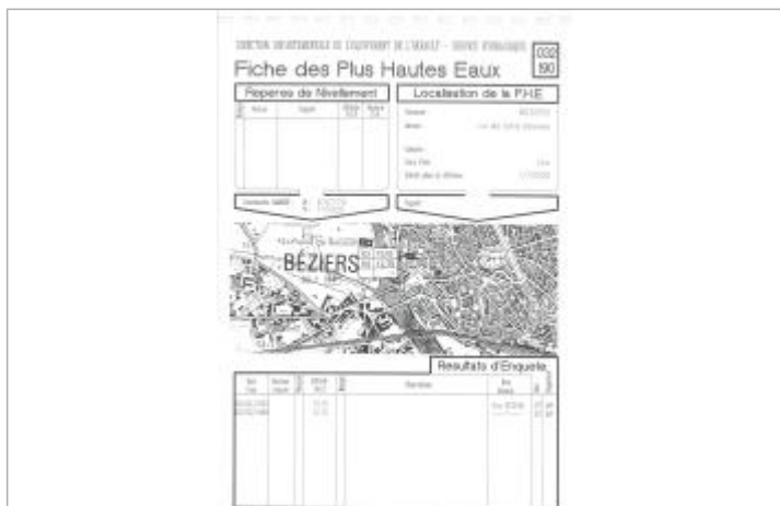
Fiche descriptive d'origine, source DDTM34