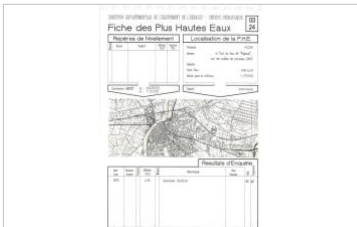
Fiche descriptive d'origine, source DDTM34