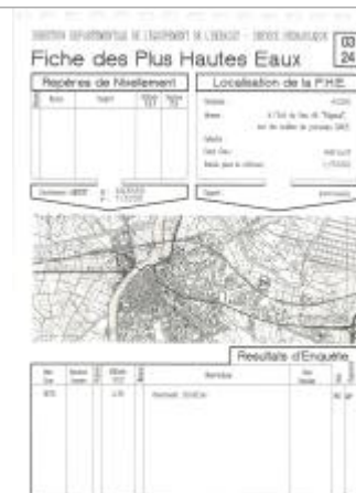
Fiche descriptive d'origine