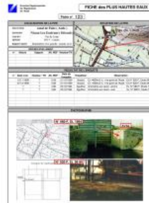
Fiche descriptive d'origine, source DDTM34

Coordonnées RGF93 (ETRS89) : X: 3.080962 / Y: 43.2656814