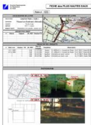
Fiche descriptive d'origine