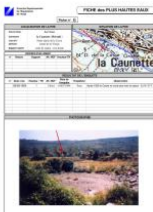
Fiche descriptive d'origine, source DDTM34