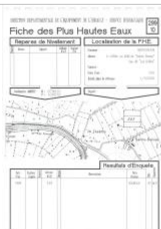
Fiche descriptive d'origine, source DDTM34

Altitude calculée de l'eau (en m) : 2.63