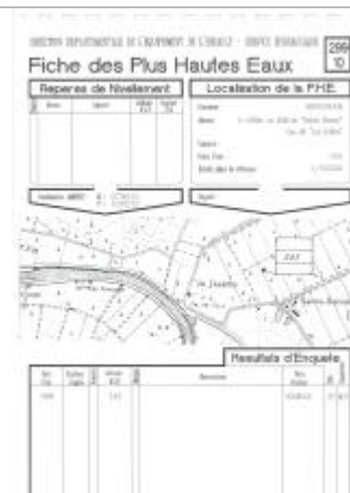
Fiche descriptive d'origine