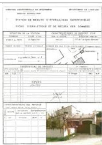
Fiche descriptive d'origine, source DDTM34

Altitude calculée de l'eau (en m) : 90.04