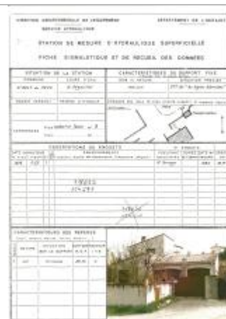
Fiche descriptive d'origine