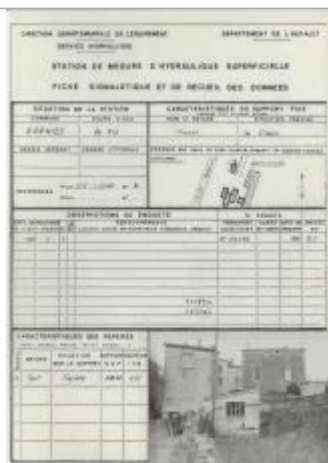
Fiche descriptive d'origine.