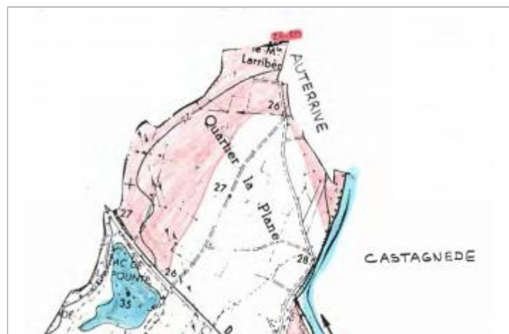
Dessin de la zone inondée

GÉNÉRAL Code : 26GAD1992_R_32_1 Date de mise à jour : 22/01/2026 Auteur : SPC GAD