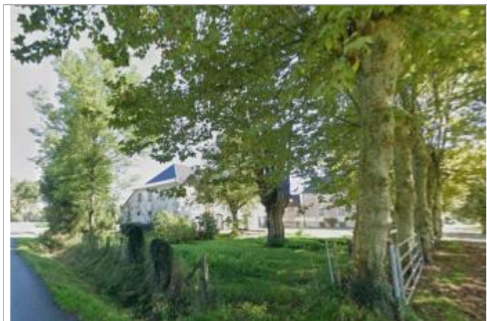
Vue du site

GÉOLOCALISATION Coordonnées WGS84 : X: -0.66029350 / Y: 43.20559610 Coordonnées RGF93 (Lambert 93) X: 402435.68 / Y: 6240940.38 Coordonnées RGF93 (ETRS89) : X: -0.6602935 / Y: 43.2055961 Code Hydro: Q70-0400 Rive de référence: Gauche