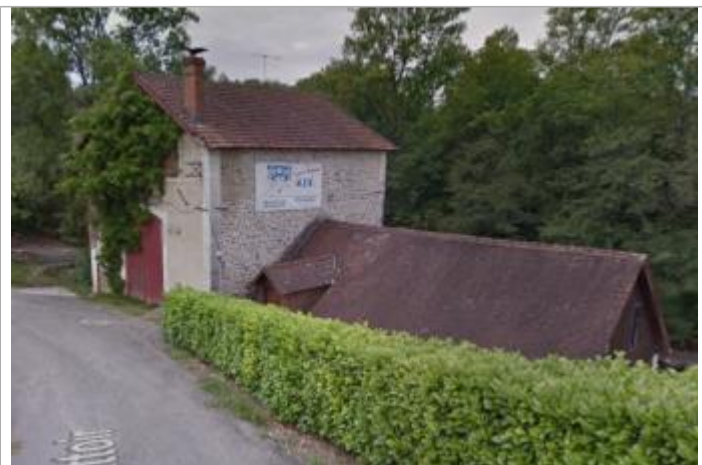
Vue du site