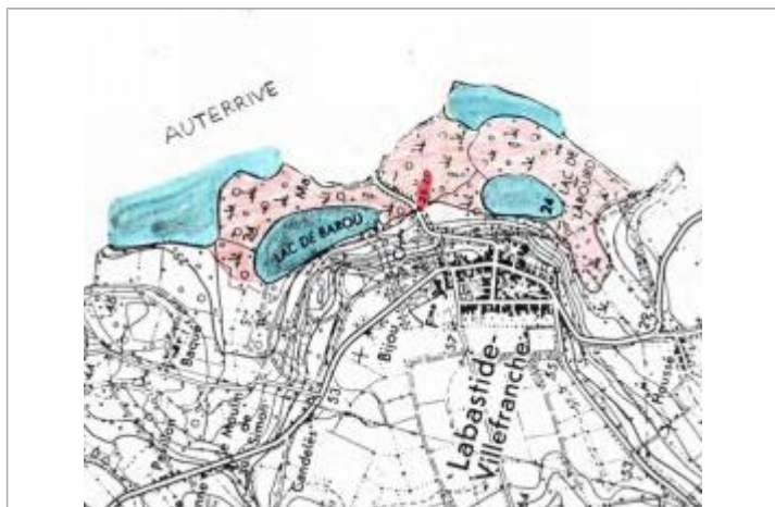
Dessin de la zone inondée