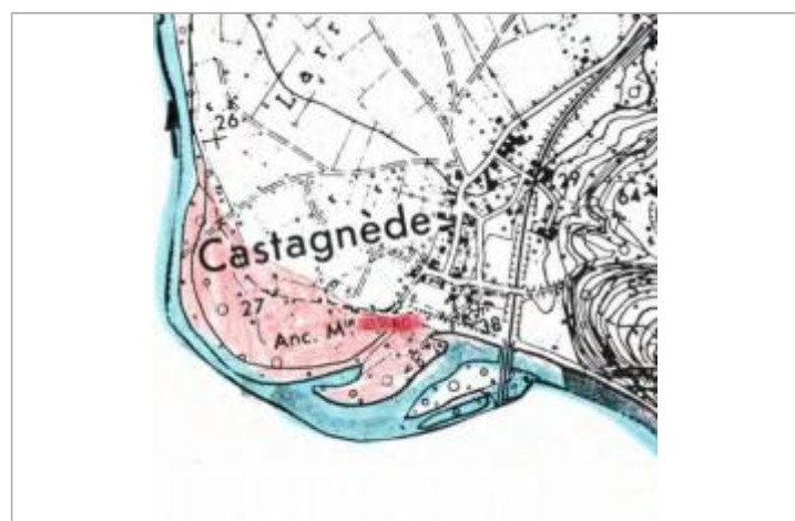
Dessin de la zone inondée