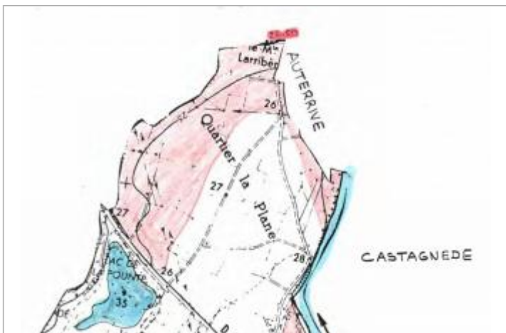
Dessin de la zone inondée