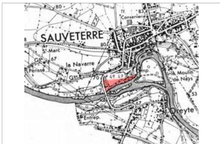
Dessin de la zone inondée

Code : 26GAD1992_R_30_1 Date de mise à jour : 22/01/2026 Auteur : SPC GAD