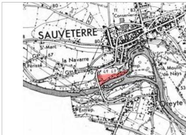
Dessin de la zone inondée