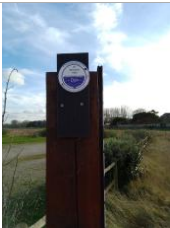
Repère de crues

Altitude calculée de l'eau (en m) : 6.18 m