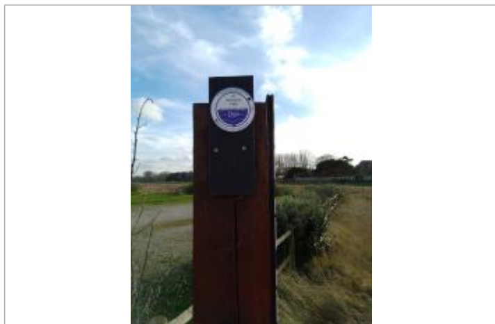
Repère de crues