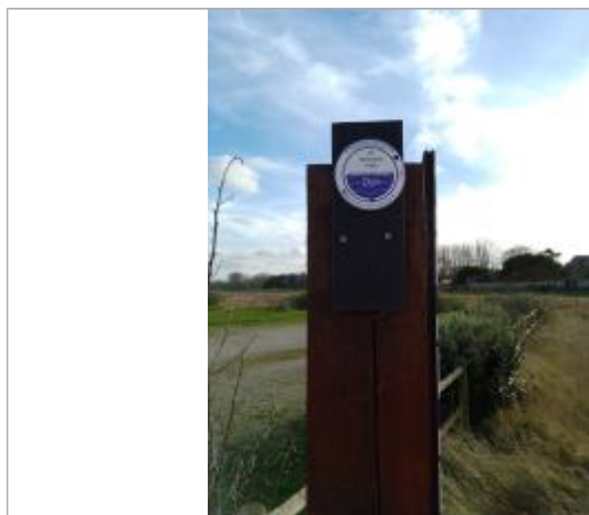
Repère de crues