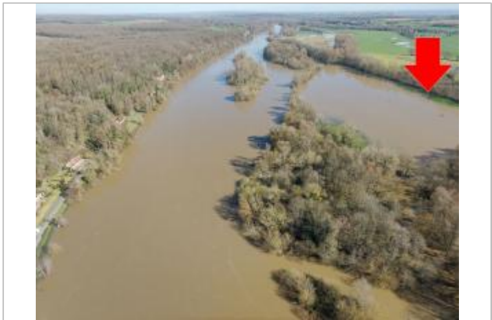
Prise de vue le 14/04/2024 à 10h30.