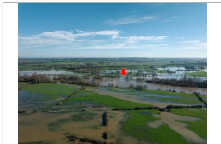
Prise de vue le 14/03/2024 à 10h15.