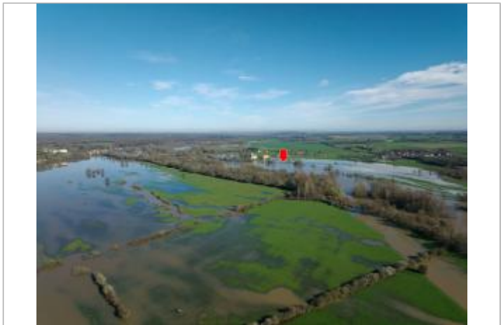
Prise de vue le 14/04/2024 à 10h15.