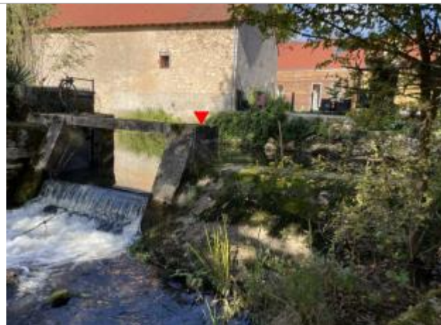
Vue du site en 2025 avec le repère de mai 2016

Coordonnées WGS84 : X: 2.15413200 / Y: 47.20323900