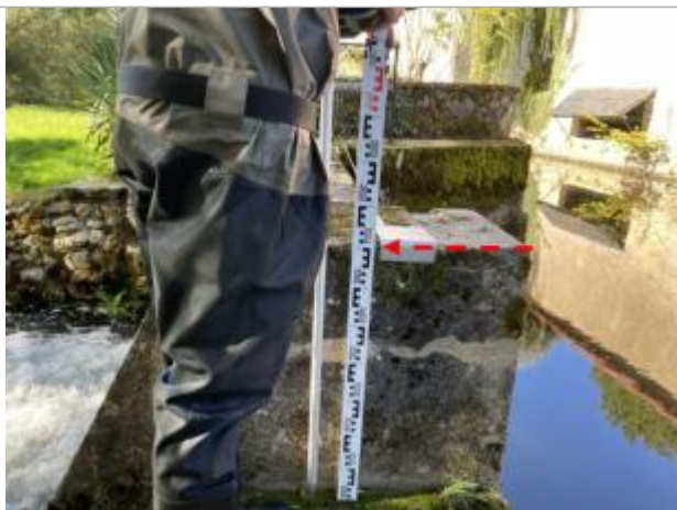
Vue du repère en 2025 (source : DH&amp;E)

Altitude calculée de l'eau (en m) : 106.09 m