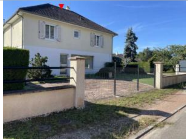
Vue du site en 2025

Coordonnées WGS84 : X: 2.16831800 / Y: 47.20169800