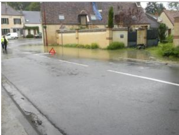
Photo prise pendant la crue

Altitude calculée de l'eau (en m) : 114.22 m