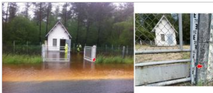
Photos prises pendant la crue (gauche) et pendant la recensement (à droite)