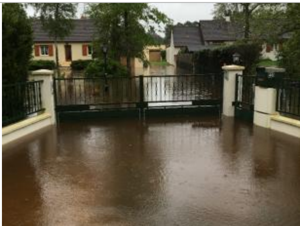
Photo prise pendant la crue

Altitude calculée de l'eau (en m) : 110.36