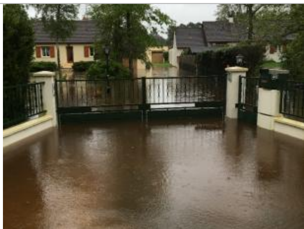
Photo prise pendant la crue

Altitude calculée de l'eau (en m) : 110.36