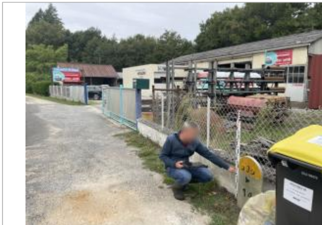
Vue du site en 2025, avec le repère de mai 2016 (source : DH&amp;E)