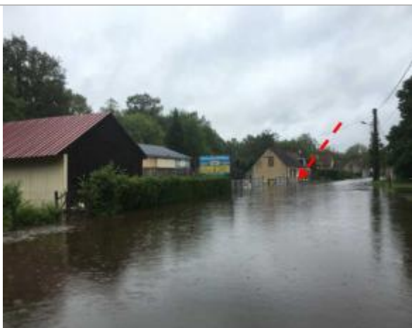
Photo prise pendant la crue