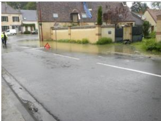
Photo prise pendant la crue