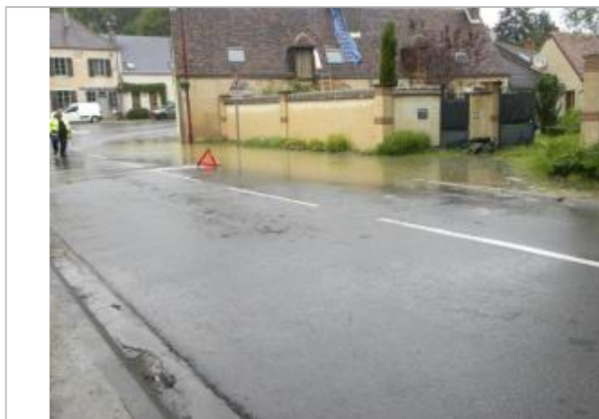
Photo prise pendant la crue