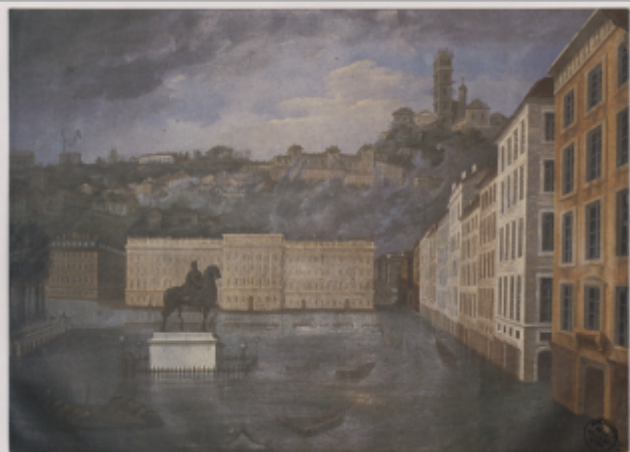
Reproduction d'un tableau non identifié, 1986 Archives municipales de Lyon, 16FI/217