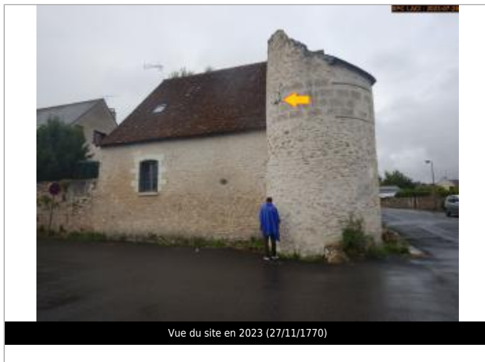
Vue du site en 2023 (27/11/1770)