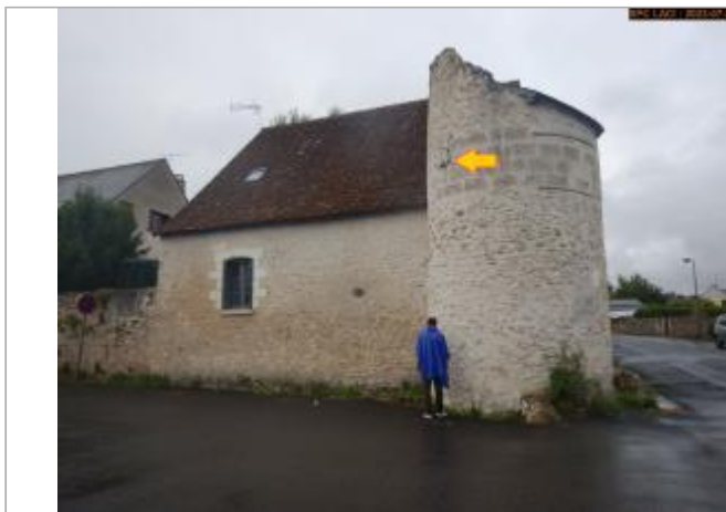
Vue du site en 2023 (27/11/1770)

Coordonnées WGS84 : X: 0.83436909 / Y: 47.26946910