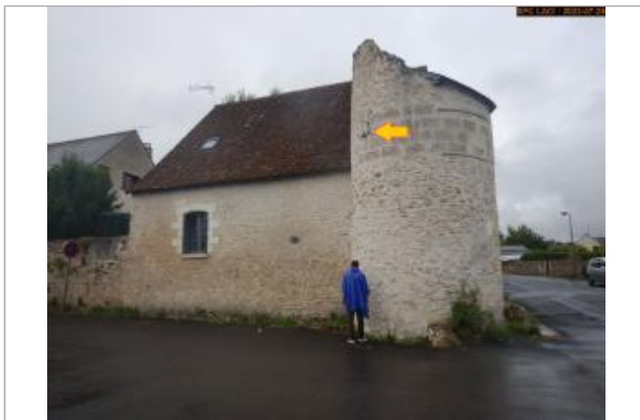
Vue du site en 2023 (27/11/1770)