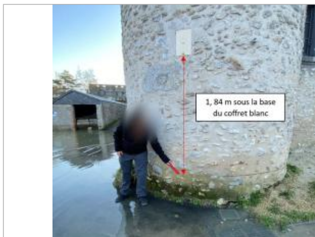
Vue du repère le 13 janvier 2025

Altitude calculée de l'eau (en m) : 58.754 m