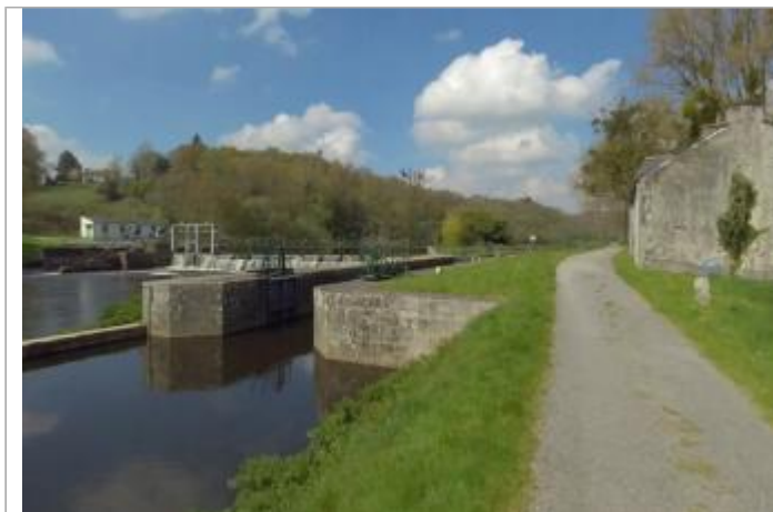
Ecluse de Moulin Neuf aval à Pluméliau-Bieuzy

Coordonnées WGS84 : X: -3.05648193 / Y: 47.96439970