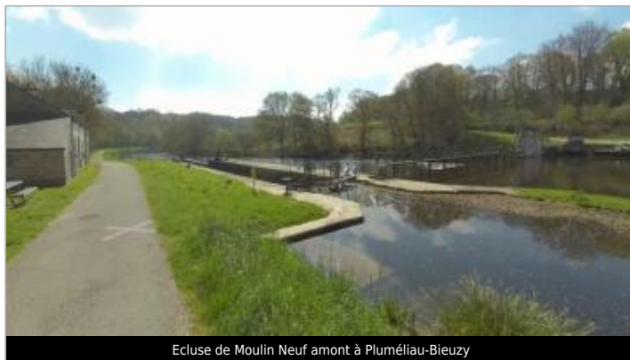
Ecluse de Moulin Neuf amont à Pluméliau-Bieuzy