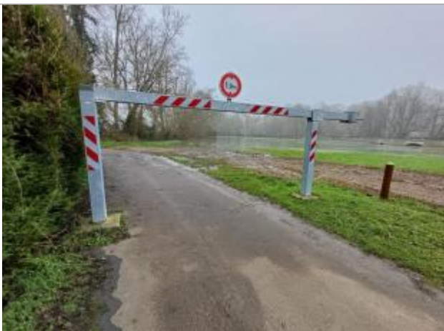
Vue du repère le 15/01/2025 à 13h55 (source : SAVI 37)

Altitude calculée de l'eau (en m) : 42.183 m