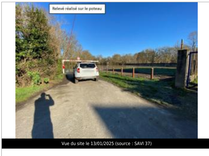
Vue du site le 13/01/2025