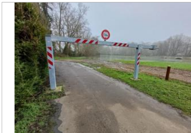
Vue du repère le 15/01/2025 à 13h55

Altitude calculée de l'eau (en m) : 42.183 m