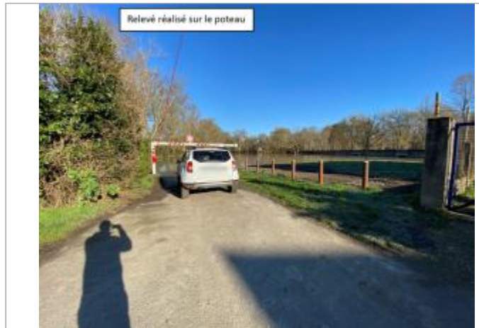
Vue du site le 13/01/2025

Coordonnées WGS84 : X: 0.46323900 / Y: 47.25672100