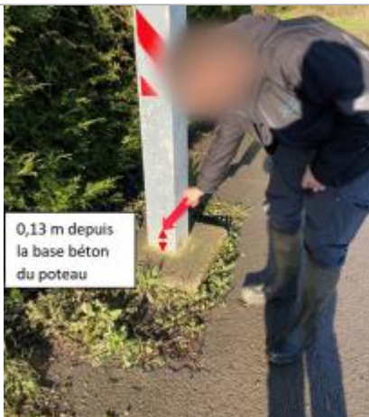
Vue du repère le 13/01/2025