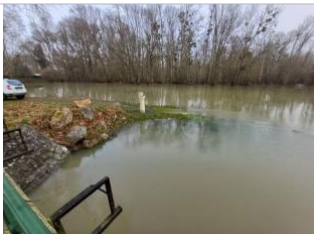
Vue du repère le 15/01/2025 à 11h35

Altitude calculée de l'eau (en m) : 47.211