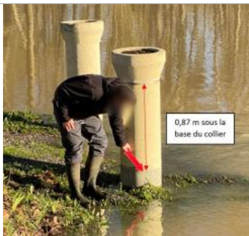
Vue du repère le 13/01/2025

SOURCE DE REPÉRAGE : SPC LACI ET SAVI 37, INDRE, RECENSEMENT JANVIER 2025 - 15/01/2025