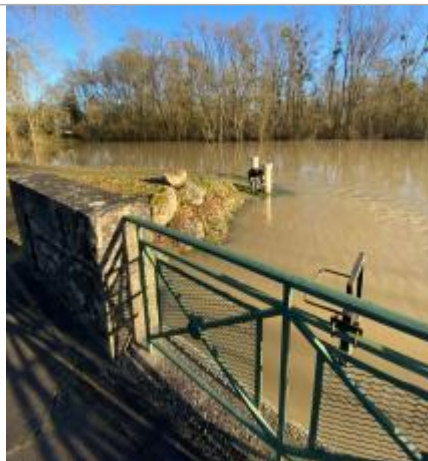
Vue du site le 13/01/2025