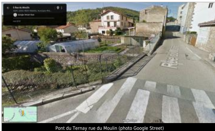
Pont du Ternay rue du Moulin