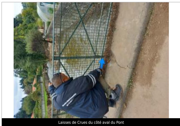
Laisses de Crues du côté aval du Pont

Altitude calculée de l'eau (en m) : 572.37