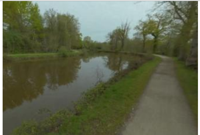
Chemin de halage en amont de le défluence Canal - rivière Ille

Coordonnées WGS84 : X: -1.63753305 / Y: 48.18495220