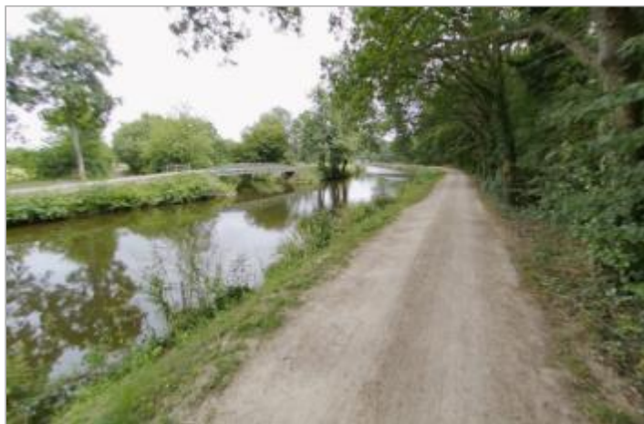
Chemin de halage en aval de la confluence Canal - rivière Ille