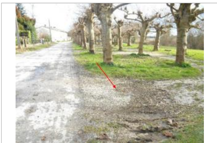
Vue du site et du repère

GÉNÉRAL Code : 26GAD_G14_R_24_1 Date de mise à jour : 14/01/2026 Auteur : SPC GAD