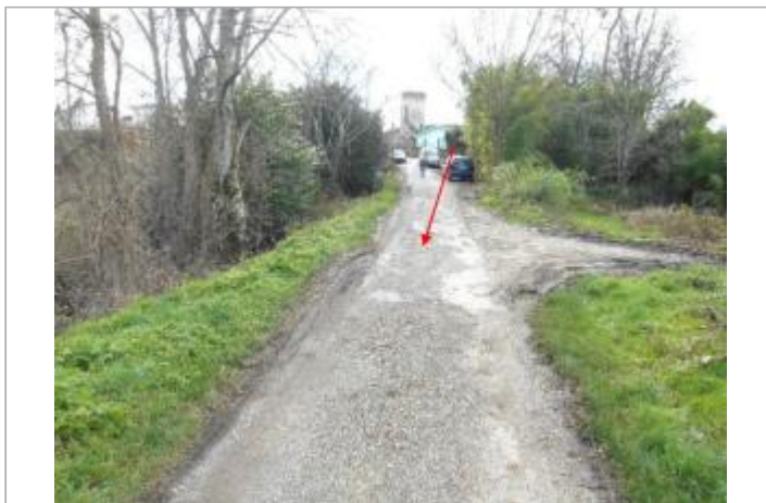
Vue du site et du repère - auteur : Artelia