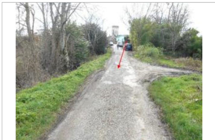
Vue du site et du repère

Maximum de l'inondation : Oui Visibilité : Non État du repère : Disparu Pérennité : Aucune Repère calculé : Non renseigné PHEC : Non renseigné