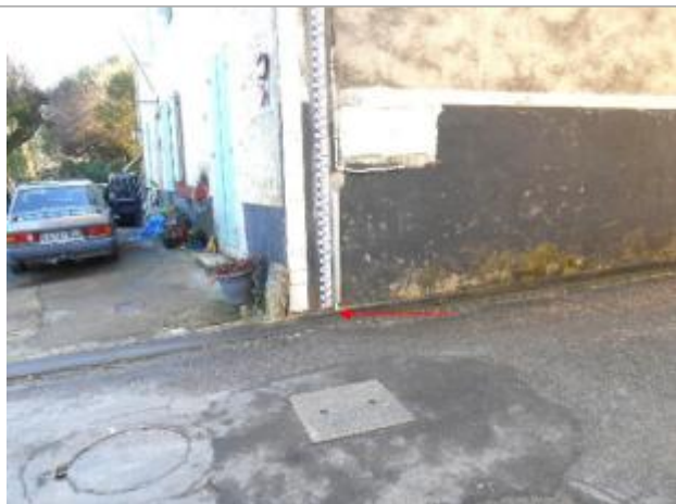
Vue du site et du repère - auteur : Artelia