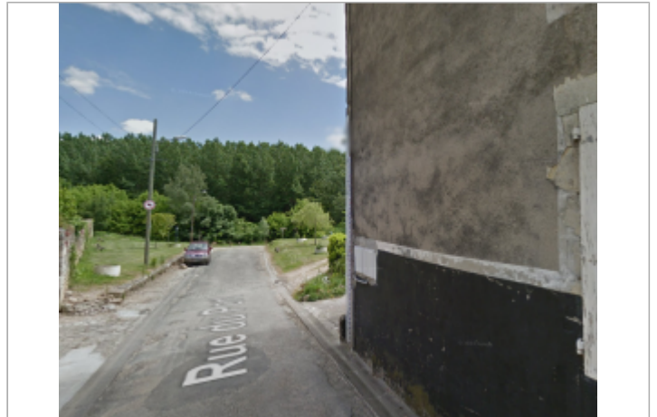
Vue du site