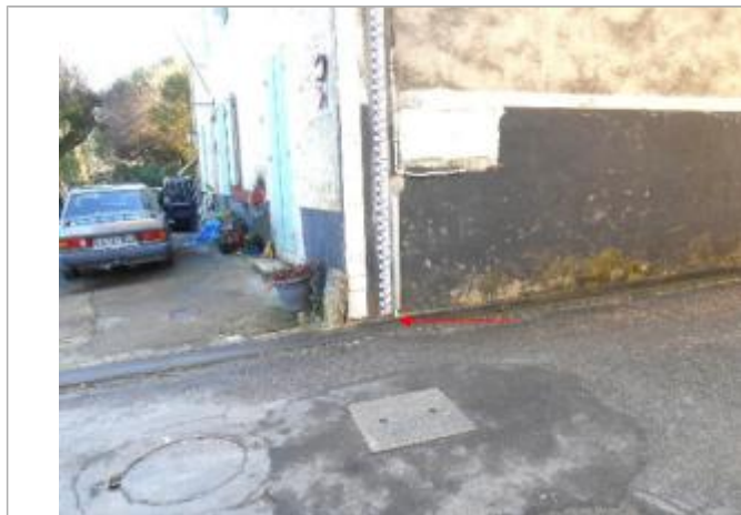
Vue du site et du repère - auteur : Artelia