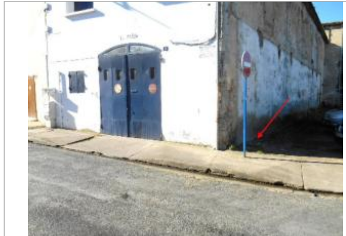
Vue du site et du repère - auteur : Artelia