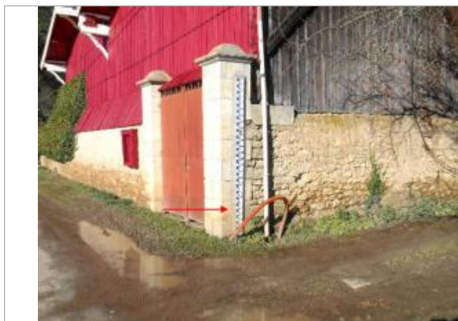
Vue du site et du repère - auteur : Artelia