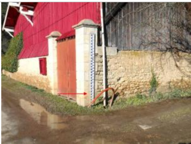
Vue du site et du repère - auteur : Artelia