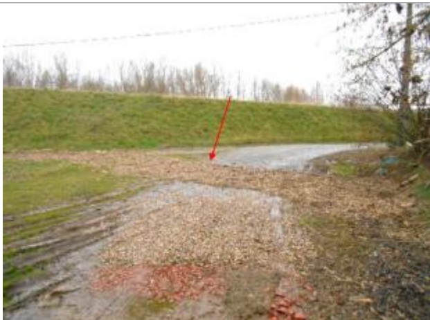
Vue du site et du repère - auteur : Artelia