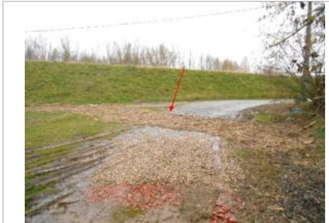
Vue du site et du repère - auteur : Artelia

Coordonnées WGS84 : X: -0.01660770 / Y: 44.57328810