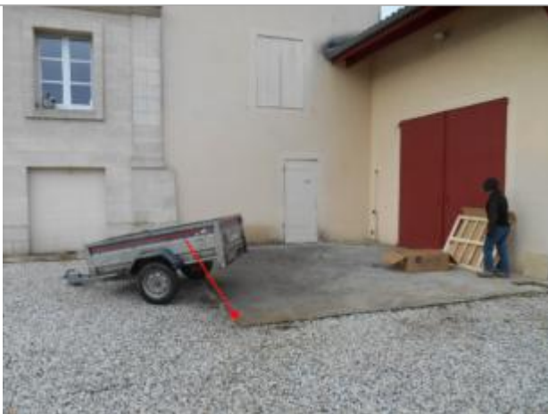
Vue du site et du repère - auteur : Artelia