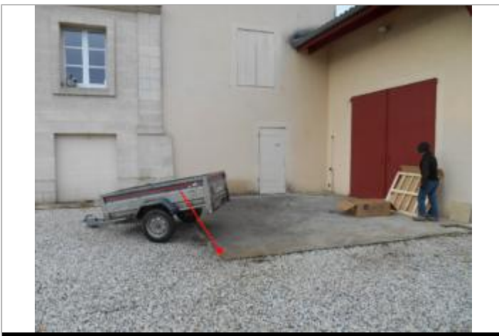
Vue du site et du repère - auteur : Artelia

GÉOLOCALISATION Coordonnées WGS84 : X: -0.39921460 / Y: 44.70071670 Coordonnées RGF93 (Lambert 93) X: 430796.19 / Y: 6405972.89 Coordonnées RGF93 (ETRS89) : X: -0.3992146 / Y: 44.7007167 Code Hydro: O--0000 Rive de référence: Gauche