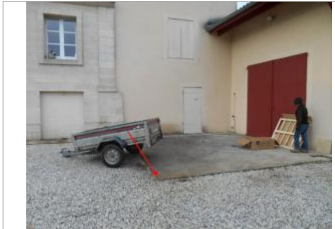
Vue du site et du repère - auteur : Artelia