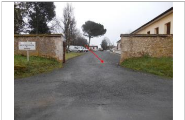
Vue du site et du repère - auteur : Artelia

MARQUE Maximum de l'inondation : Oui Visibilité : Non État du repère : Disparu Pérennité : Aucune Repère calculé : Non renseigné PHEC : Non renseigné