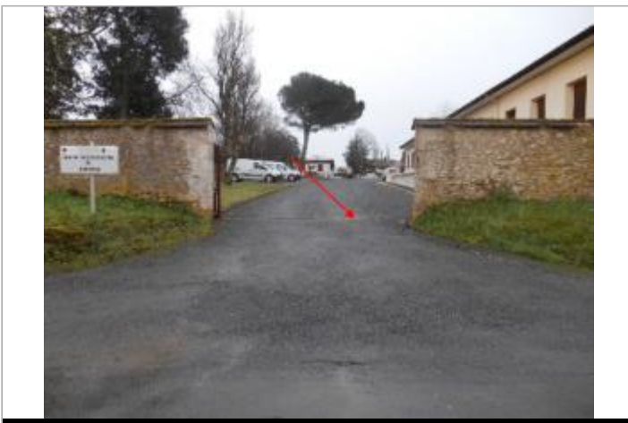
Vue du site et du repère - auteur : Artelia

GÉOLOCALISATION Coordonnées WGS84 : X: -0.35440540 / Y: 44.65376340 Coordonnées RGF93 (Lambert 93) X: 434121.25 / Y: 6400610.42 Coordonnées RGF93 (ETRS89) : X: -0.3544054 / Y: 44.6537634 Code Hydro: O---0000 Rive de référence: Gauche