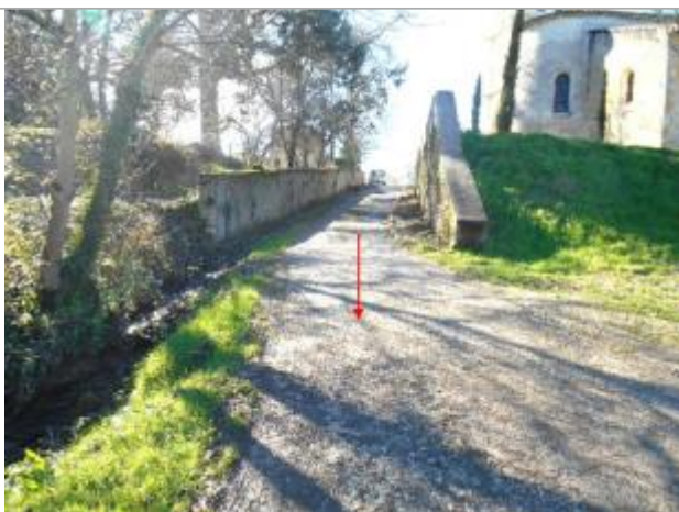
Vue du site et du repère - auteur : Artelia