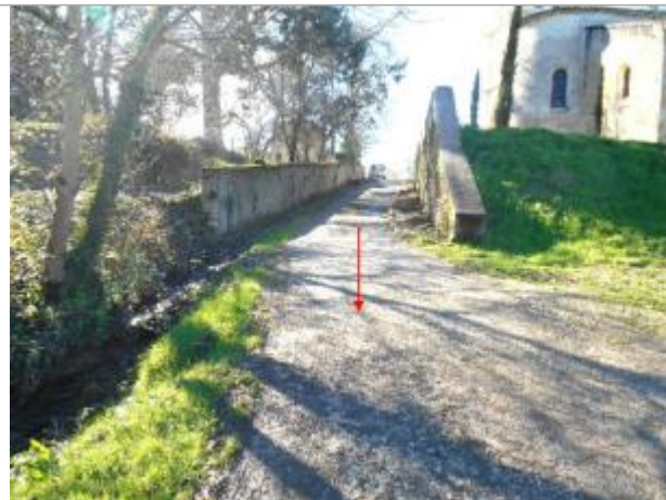
Vue du site et du repère - auteur : Artelia