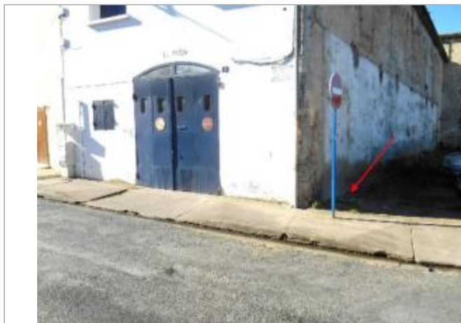
Vue du site et du repère - auteur : Artelia